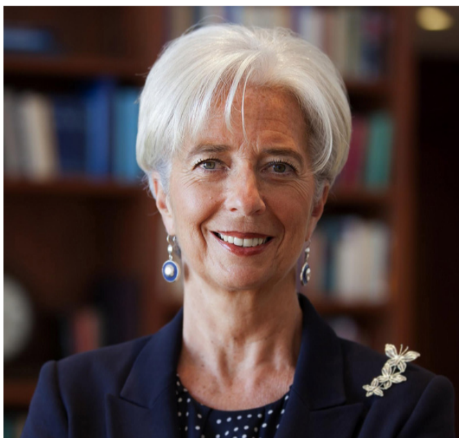
Christine Lagarde, presidenta del Banco Central Europeo, política, abogada y empresaria