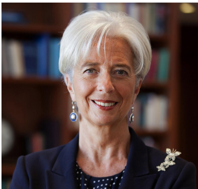
Christine Lagarde, president of the European Central Bank, politician, lawyer and business woman.