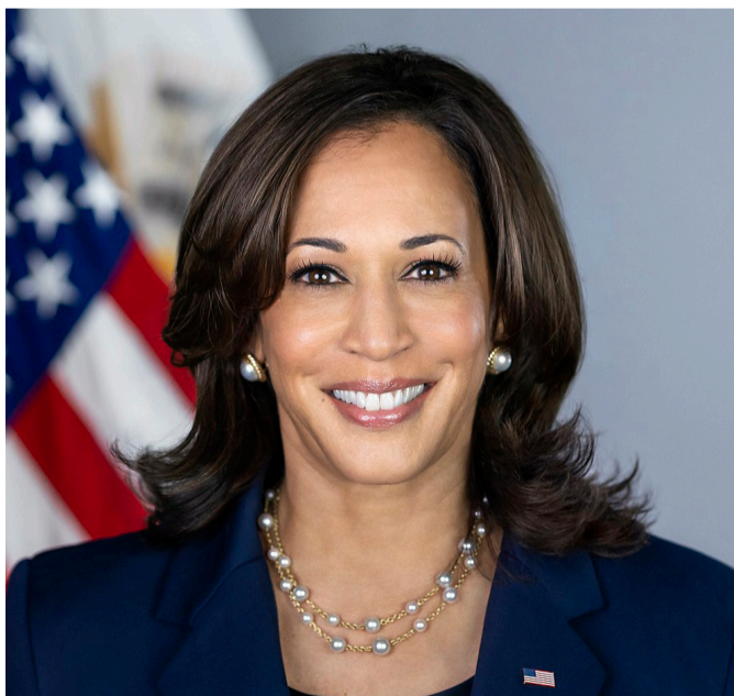
Kamala Harris, vicepresidenta de los Estados Unidos

Estas son las cinco reglas que permitirán a la mujer del mañana florecer, romper el techo de cristal y finalmente ser considerada al mismo nivel que los hombres.