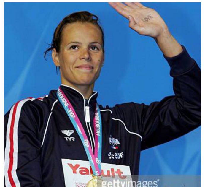
Laure Manaudou, nadadora, campeona olímpica en 2004