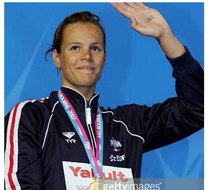
Laure Manaudou, swimmer, Olympic Games 2004 champion.