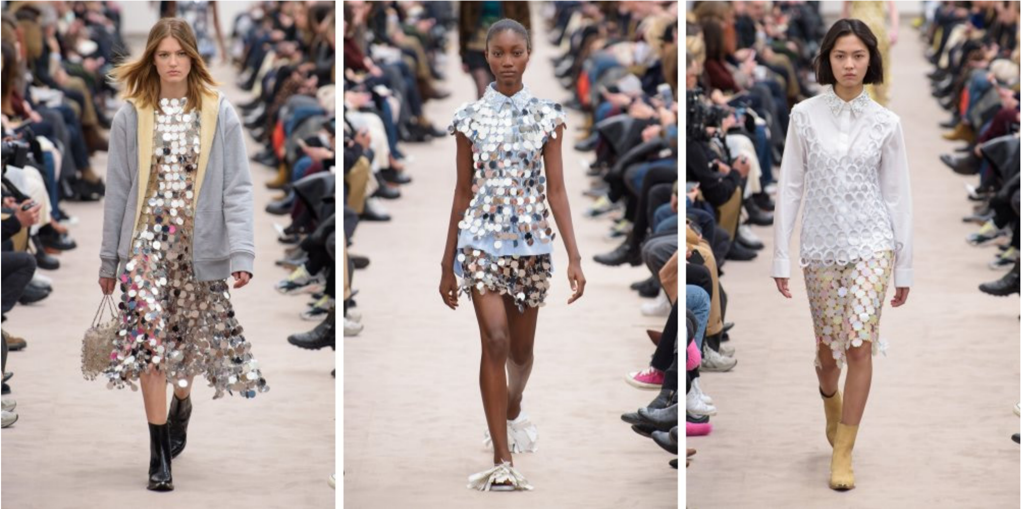
Desfile Otoño-Invierno 2018-19 de Paco Rabanne, diseñador español

La exposición sobre la evolución de la mujer mostrará también su evolución en cuanto a moda.