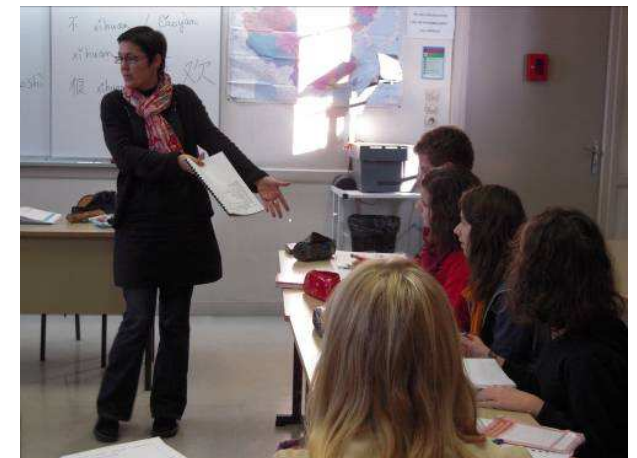
Le cours de chinois

Ce cours est l'occasion pour les élèves de découvrir une langue originale, ludique mais aussi exigeante. Elle amène les élèves à acquérir une méthodologie particulière : une aide précieuse dans tous les domaines d'apprentissage. Ce cours est également une fenêtre sur une culture pluri-millénaire, riche et passionnante.