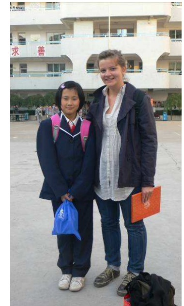
Les élèves y sont hébergés en famille, chez les jeunes collégiens de l'établissement